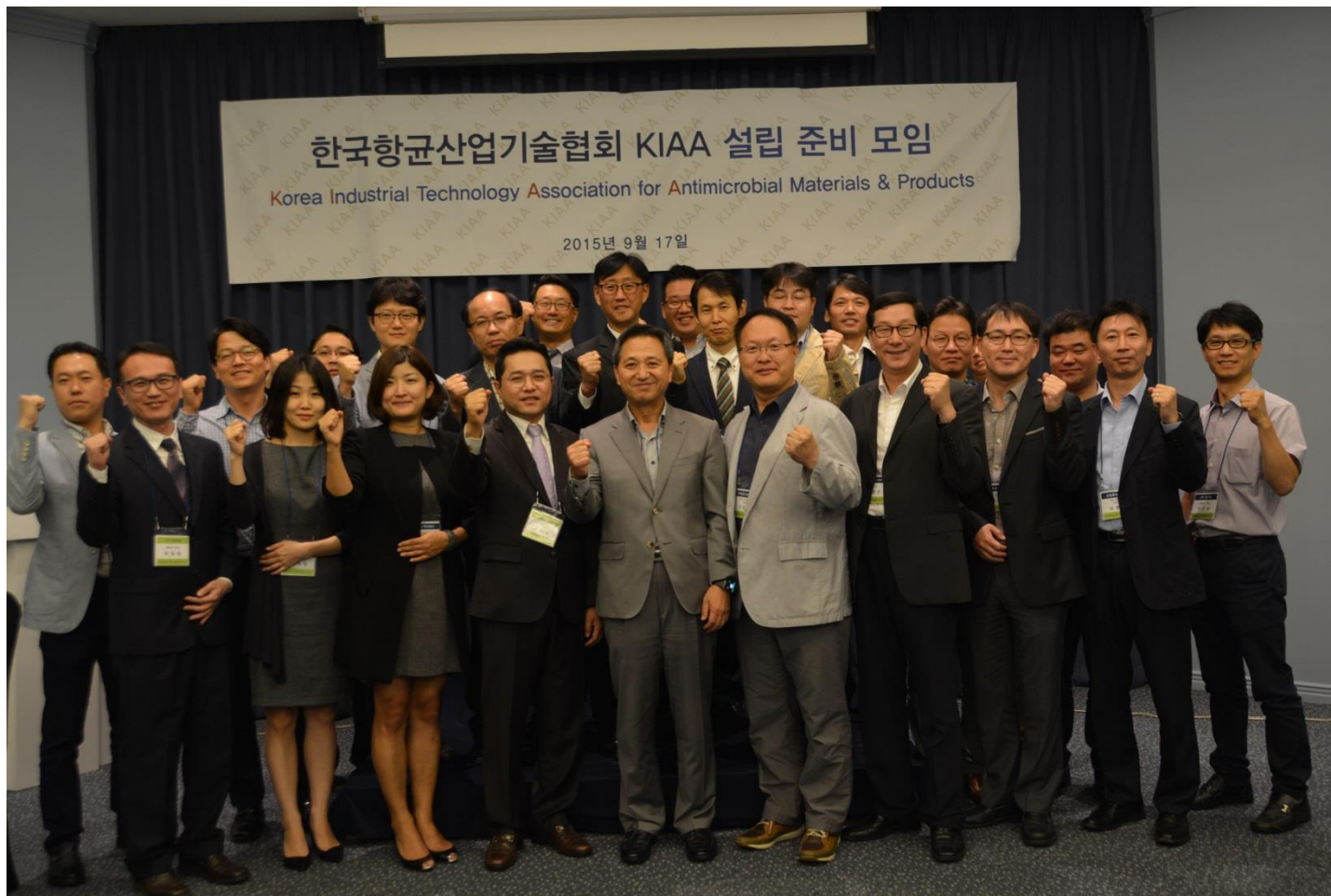
- 準備会の報告会后、参加者との記念撮影